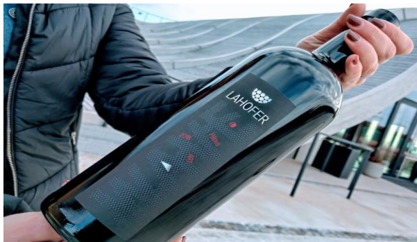
Výrobní řada WAVE / ART