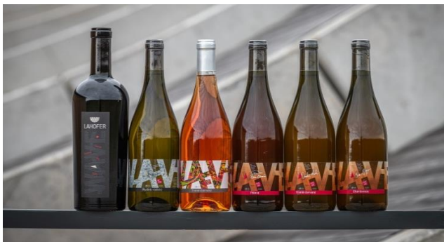
Výrobní řada WAVE / ART, BETON, YOUTH, KVEVRI

*) Řada WAVE je nová výrobní řada Vinařství LAHOFER inspirovaná "vlnou". Architektonickou vlnou nové budovy Vinařství LAHOFER, ale především: novou vlnou technologických možností. Přestěhováním do nových prostor se možnosti výroby od roku 2020 podstatně rozšířily. Řada vín WAVE prezentuje vína vyrobená ve Vinařství LAHOFER do té doby nevyzkoušenými metodami, a to především v betonových tancích, dřevěných sudech či kvevri nádobách. Špičkovým vínem řady WAVE je pak edice ART.