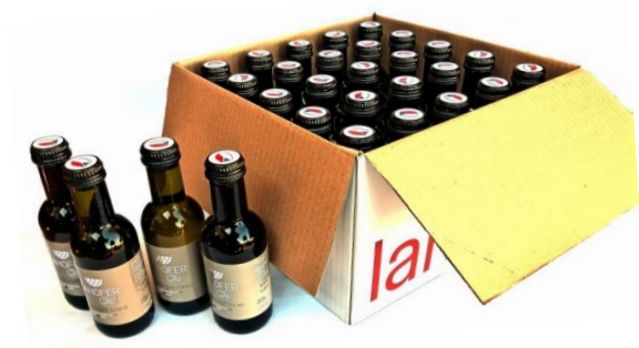
Karton s 25 ks lahviček o objemu 0,187 l.

**) Lahve o objemu 0,187 l nabízíme k prodeji pouze v kartonu po 25 ks od jedné šarže.