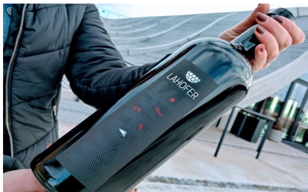
Výrobová řada WAVE / ART