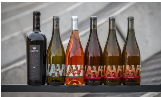
Výrobová řada WAVE / ART, BETON, YOUTH, KVEVRI

*) Řada WAVE je nová výrobová řada Vinařství LAHOFER inspirovaná "vlnou". Architektonickou vlnou nové budovy Vinařství LAHOFER, ale především: novou vlnou technologických možností. Přestěhováním do nových prostor se možnosti výroby od roku 2020 podstatně rozšířily. Řada vín WAVE prezentuje vína vyrobená ve Vinařství LAHOFER do té doby nevyzkoušenými metodami, a to především v betonových tancích, dřevěných sudech či kvevri nádobách. Špičkovým vínem řady WAVE je pak edice ART.