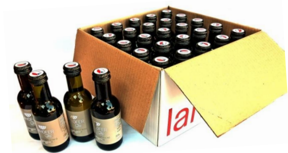
Karton s 25 ks lahviček o objemu 0,187l.

***) Lahve o objemu 0,187l nabízíme k prodeji pouze v kartonu po 25 ks od jedné šarže.