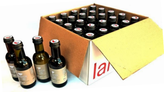
Karton s 25 ks lahviček o objemu 0,187 l.

***) Lahve o objemu 0,187 l nabízíme k prodeji pouze v kartonu po 25 ks od jedné šarže .